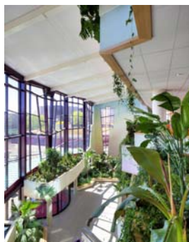
Ospedale "Isala" a Zwolle (NL)

Alberts & Van Huut International Architects in collaborazione con Aan de Amstel Architects